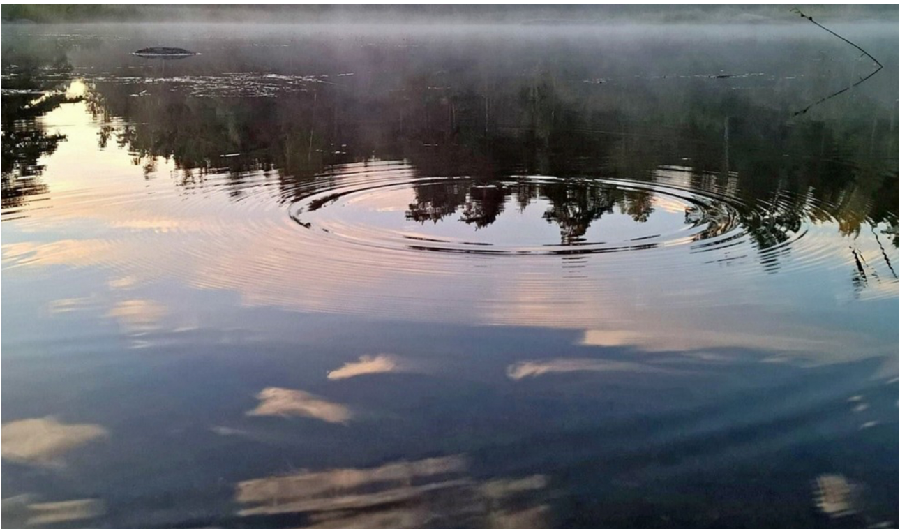
Hän armahtaa meitä jälleen, polkee maahan meidän pahat tekomme. Kaikki heidän syntinsä sinä heität meren syvyyteen. (Miika 7:19)

Vanhan testamentin puolella katsotaan kuin tulevaan. Kuitenkin nämä kuvataulut ovat kirkkaat ja selkeät osoittaessaan eteenpäin kohti Kristuksen ristiä ja siellä tapahtunutta syntien sovitusta. Pyhä Jumala ei vain mitätöinyt syntiä, pyyhkinyt pois, unohtanut. Hän maksoi siitä kalliin hinnan, uhrasi oman Poikansa, osoitti rakkautensa ja tahtonsa olla yhteydessä luomiinsa ihmisiin. Sen vuoksi katsomme Kristukseen samalla, kun näemme kiven jättämät renkaat veden pinnassa.